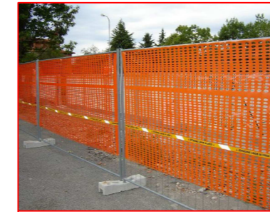
posa recinzione di cantiere