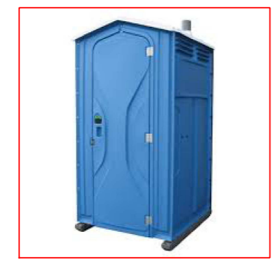
w.c. chimico prefabbricato