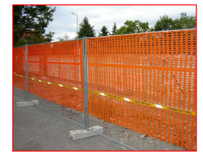
rimozione recinzione esistente e posa recinzione di cantiere